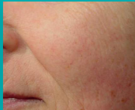
Na 6 behandelingen