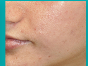
Na 8 behandelingen